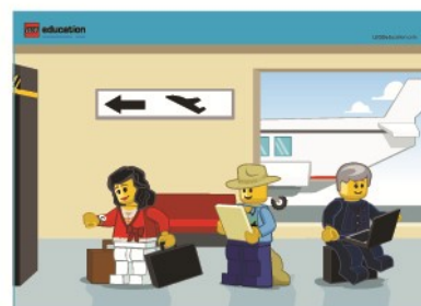
K motivaci příběhu využijte námětovou kartu